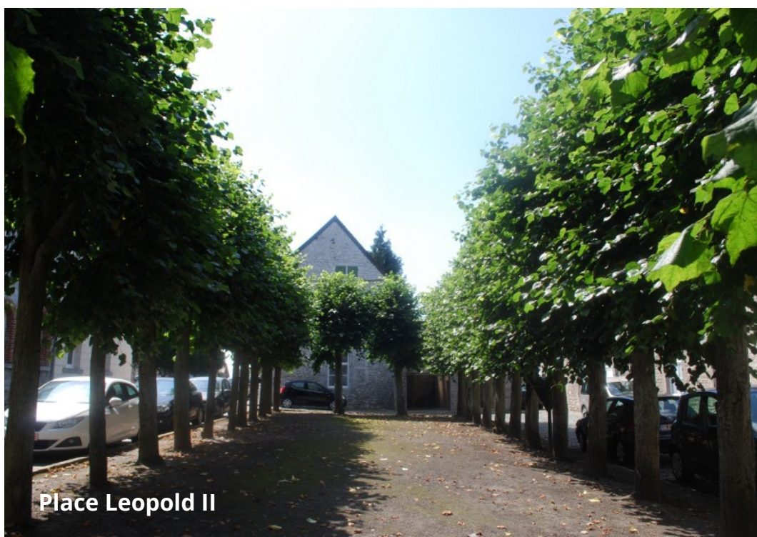
Place Leopold II