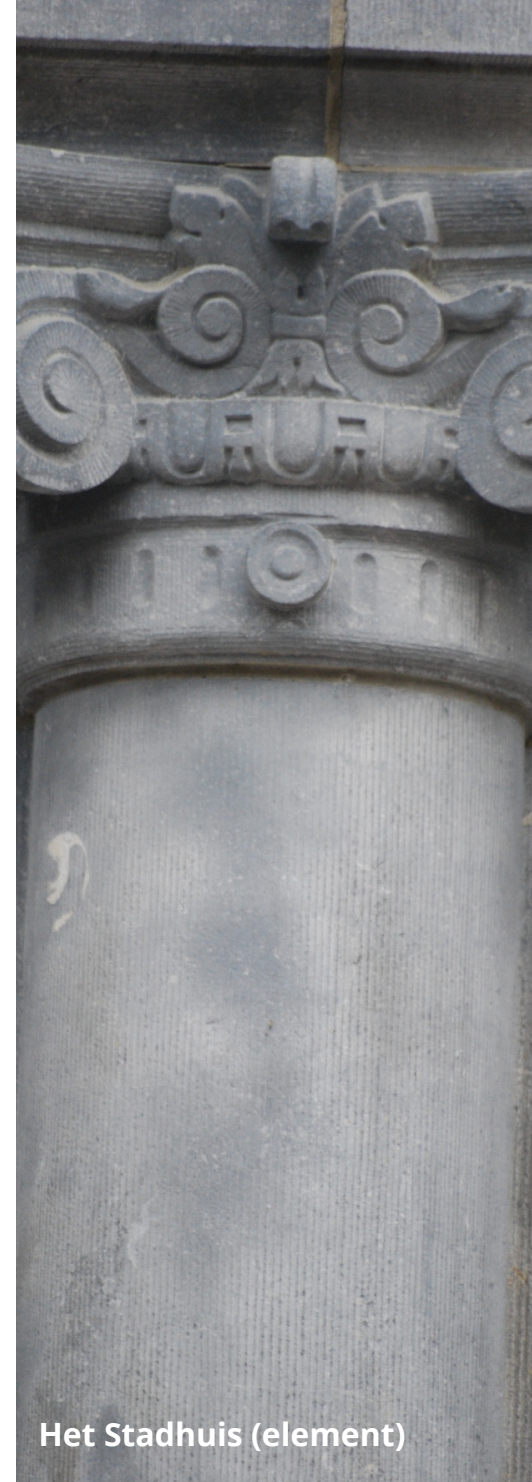
Het Stadhuis (element)