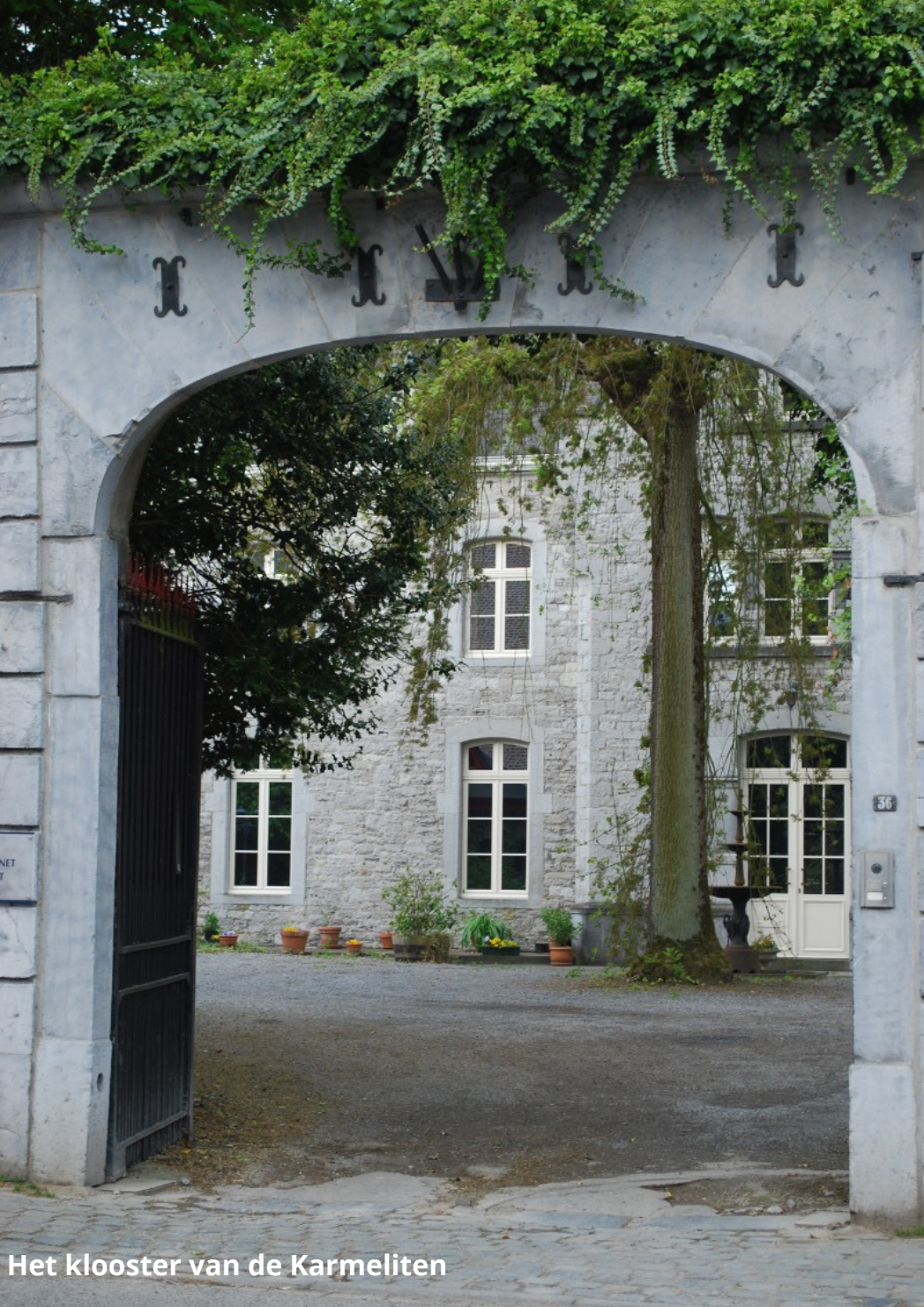
Het klooster van de Karmeliten