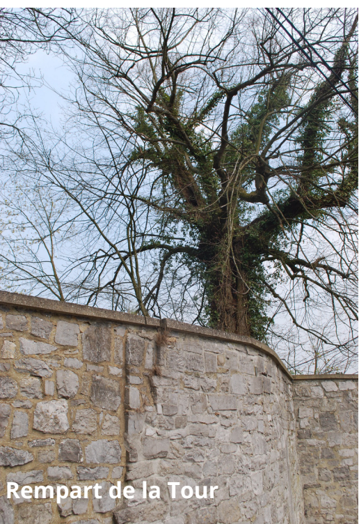
Rempart de la Tour